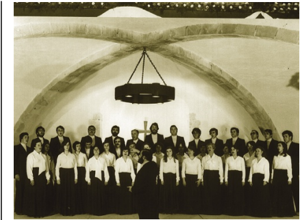
La Coral Verge del Camí es va formar l'any 1968