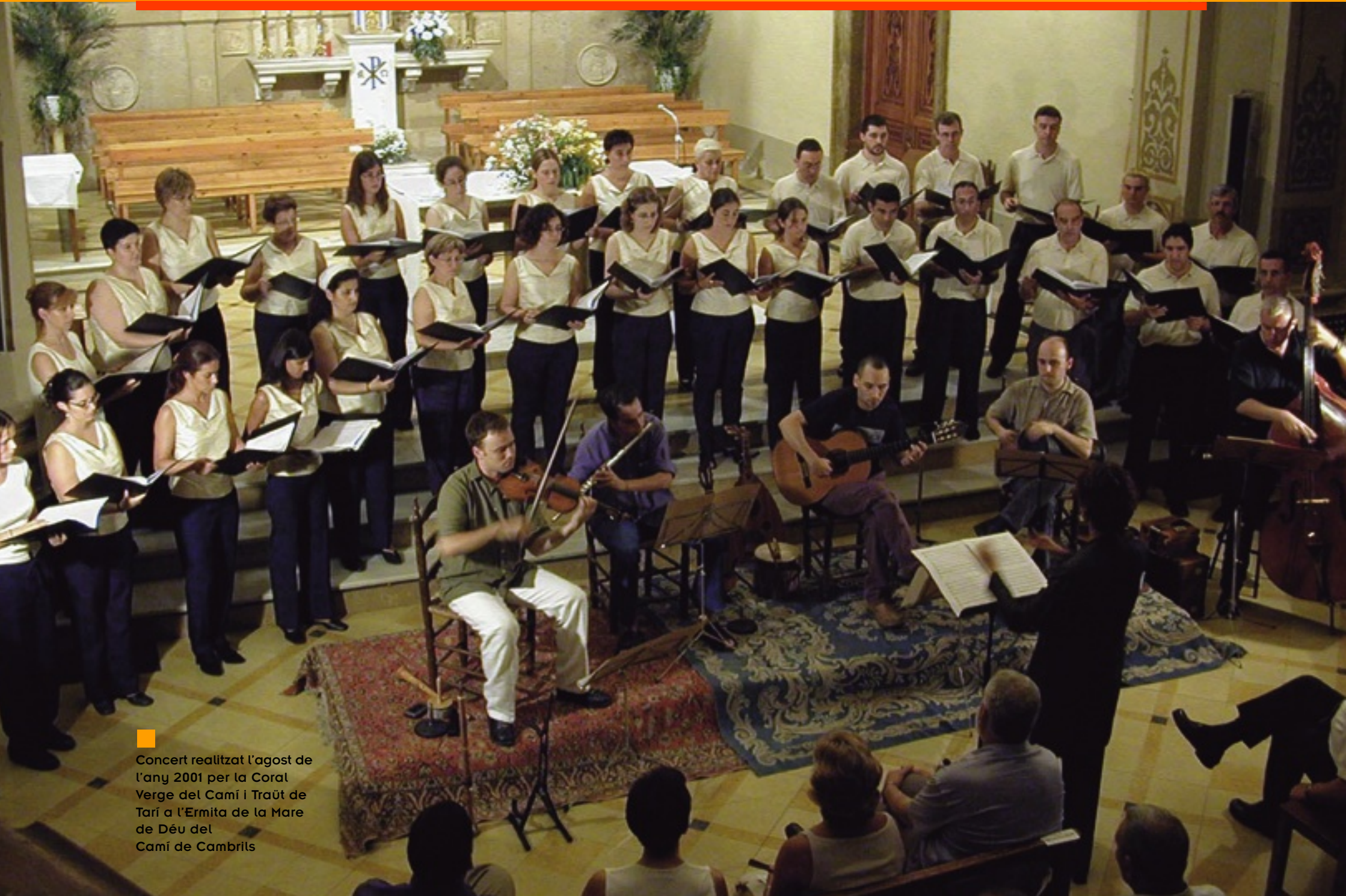
■ Concert realitzat l'agost de l'any 2001 per la Coral Verge del Camí i Traüt de Tarí a l'Ermida de la Mare de Déu del Camí de Cambrils