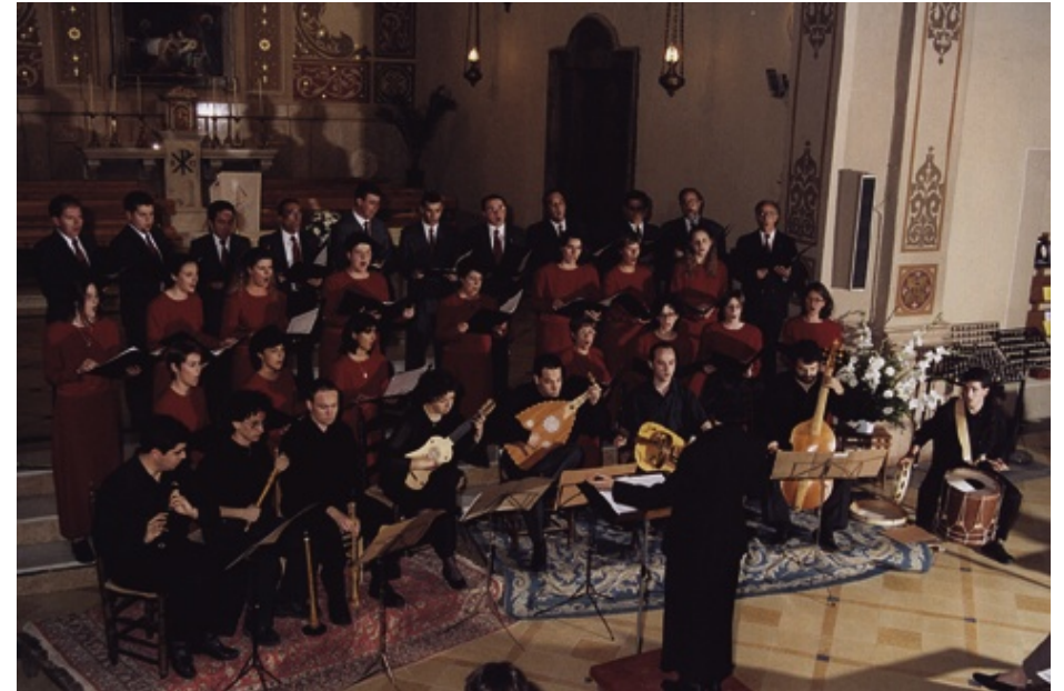
Actuació de la Coral Verge del Camí conjutament amb el grup de música antiga Renatus